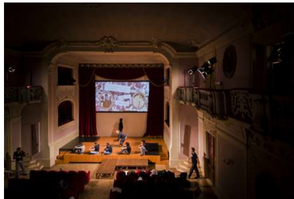
Fig. 3 | Gli attori in prova durante un intermezzo.