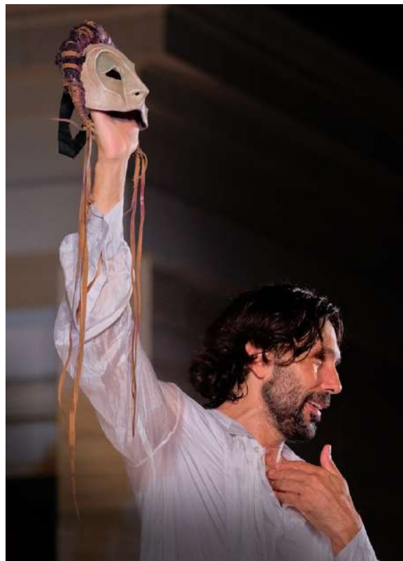
Fig. 2 | Socrates’ poetic mimesis of Diotima in Poggioni’s performance.

cambio personaggio spogliandomi, non aggiungendo. Il percorso di Platone a cui voglio dare voce è quello che mira a giungere alla verità sull’Amore, su Eros. E la verità la si raggiunge per spoliazione, andando a trovare quella semplicità finale, che non è semplificazione, ma richiede che si passi attraverso i discorsi di tutti gli altri ospiti, uno dopo l’altro. Alla fine, Socrate è in una semplice tunica, mentre i primi personaggi hanno tutti i loro orpelli: il cappello, i guanti, eccetera. 9