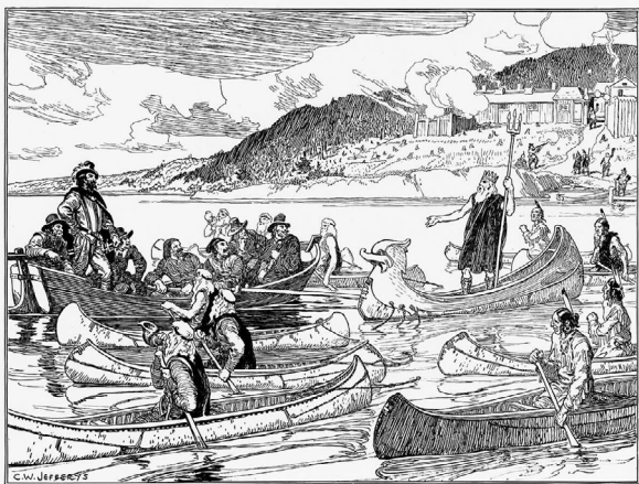
Fig. 3 | C. W. Jefferys, Performance of Théâtre de Neptune , in Canada's Past in Pictures , 1934, Harvard College Library, Cambridge MA.