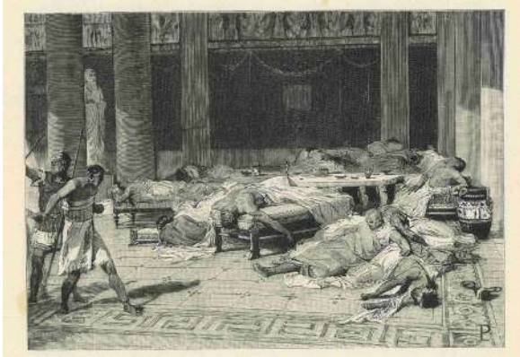
Fig. 1 | Banchetto capuano e suicidio dei senatori, 211 a.C. , incisione tratta da BERTOLINI F., Storia di Roma , ill. di POGLIAGHI L., Treves, Milano 1901, p. 161.

mente retorico di fronte ai suoi concittadini. Nell'ultima parte del monologo egli annuncia l'intenzione di suicidarsi, come ultimo atto di resistenza al potere romano e alle conseguenti sofferenze che avrebbero patito una volta riconquistati, invitando i notabili a un banchetto che possa fornire una "fine oltre che onorevole anche dolce": 7