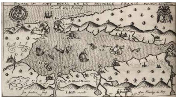
Fig. 1 | Marc Lescarbot, Port Royal , in Histoire de la Nouvelle-France , 1609, Nova Scotia Archives Map collection, Annapolis Royal.

La prima rappresentazione teatrale attestata al di fuori dei territori di dominazione spagnola e portoghese fu Le Théâtre de Neptune en la Nouvelle-France (1606) di Marc Lescarbot. L'arrivo all'accampamento di Fort Royal (attuale Lower Granville), centro della colonia francese nota come Nouvelle-France, del generale francese Jean de Poutrincourt e dell'esploratore Samuel Champlain di ritorno da una missione nell'attuale New England fu celebrato con una réception , un banchetto con rappresentazioni sceniche e discorsi celebrativi di benvenuto ( compliments ). [Fig. 1]