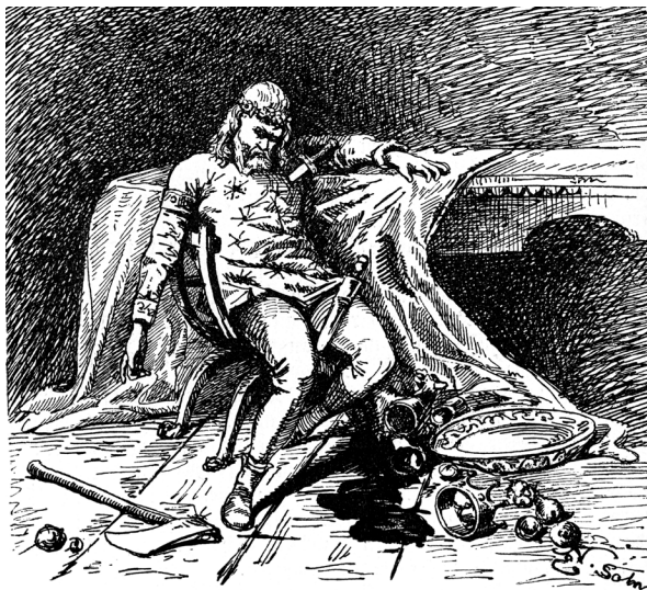
Fig. 4 | Odoacer death , incisione su legno del sec. XIX (Credits: Alamy Stock Photo, lic. CY96233722).

E per un certo tempo gli accordi furono osservati; ma poscia Teoderico, accortosi, come dicono, che Odoacre macchinava insidie contro di lui, ingannevolmente invitatolo a banchetto, lo uccise [...] (Procop. Goth. I 1,24) (Comparetti 2005: 6). 30