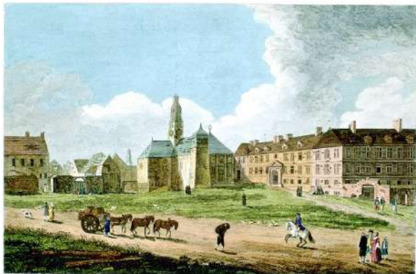
Fig. 5 | Richard Short, A view of the Jesuits College and Church , 1761, Archives Nationales du Canada, Ottawa.

Fu la matrice gesuita a segnare la cultura teatrale moderna della Nouvelle-France attraverso le réceptions con banchetti allestiti nei collegi. Appare significativo che le relazioni dei gesuiti non solo attestino l'ampia diffusione di tale tipologia spettacolare fino alla fine del Seicento, ma che per più di un secolo rappresentino anche le fonti principali del teatro canadese.