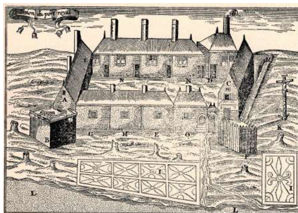
Fig. 4 | Samuel Champlain, Habitation de Port Royal , in Les Voyages du Sieur de Champlain , 1613, Nova Scotia Archives, Halifax.

Questo passaggio è evidentemente un'evocazione del Salmo 143 delle Sacre Scritture (" Expandi manus meas ad te; anima mea sicut terra sine aqua tibi "), ma anche del quinto capitolo del primo libro di Gargantua e Pantagruelle (1542) di François Rabelais,