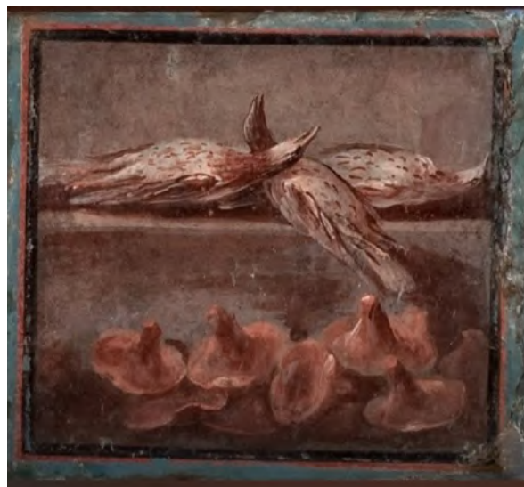
Fig. 3 | SPINA L., Quadri di nature morte ; Ercolano, Casa dei Cervi, IV 21, fotografia esposta presso il Museo Archeologico Nazionale di Napoli - MANN (n. inv. 8647).

Sulla tavola dell'imperatore sono serviti spesso boleti , termine latino che nell'antica Roma sta però a indicare la famiglia delle Amanita , che può includere l' Amanita caesarea (il fungo prediletto, "cibo degli dèi", corrispondente al nostro ovolo e di alta commestibilità), ma anche l' Amanita phalloides , ai giorni nostri responsabile del 95% delle morti dovute a consumo di funghi. Non si può escludere che il decesso di Claudio sia dovuto quindi a una banale fatalità, ossia all'ingestione di un fungo tossico per natura, in quantità eccessiva e a fronte di un fisico già debilitato (Grimm-Samuel 1991: 178-192). 25