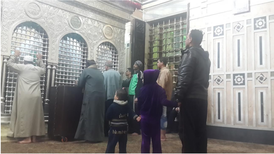
Fedeli nella parte della tomba di al-Sayyida Zaynab al Cairo riservata agli uomini (foto di Mohamed Magdy, febbraio 2015).