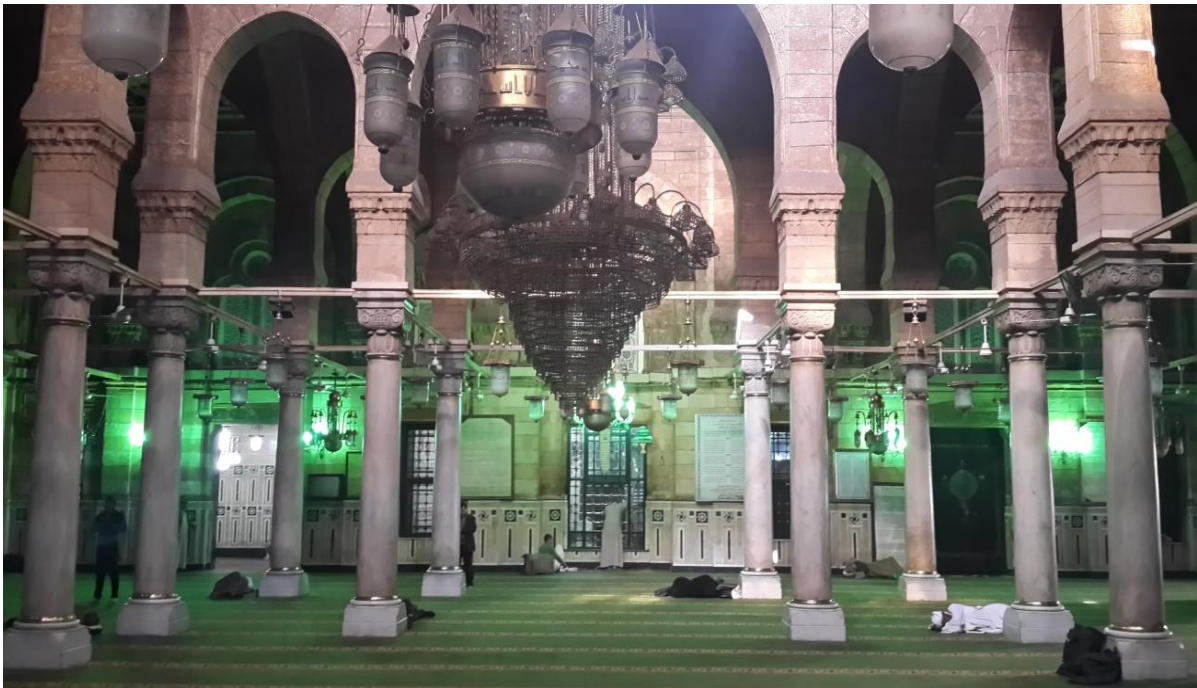
Interno della moschea di al-Sayyida Zaynab al Cairo (foto di Mohamed Magdy, febbraio 2015).