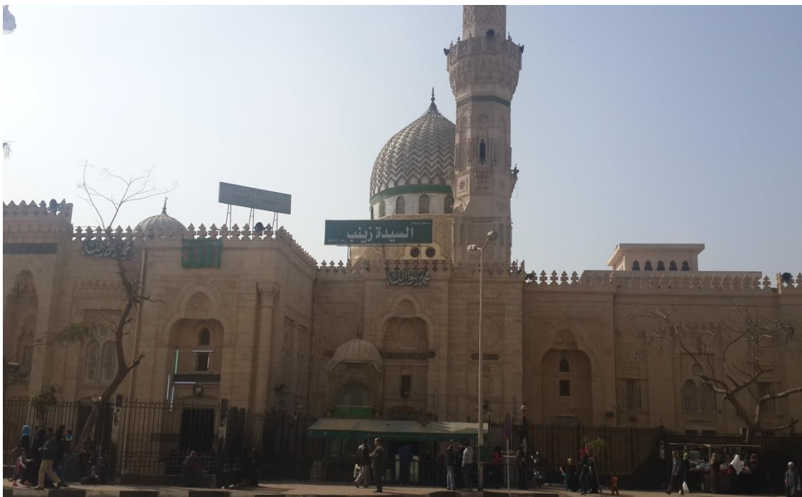
Attuale moschea di al-Sayyida Zaynab al Cairo (maggio 2014).