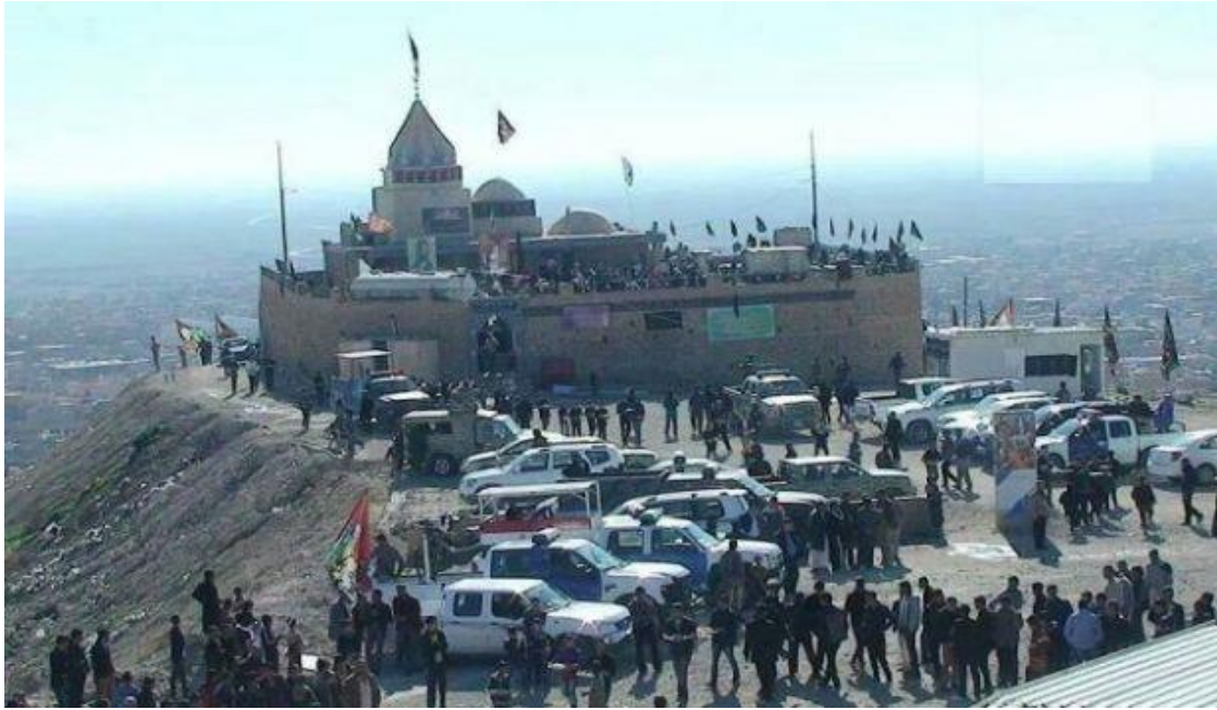
La moschea-mausoleo di al-Sayyida Zaynab a Singār in Iraq prima della distruzione a opera dell'IS nel 2014.