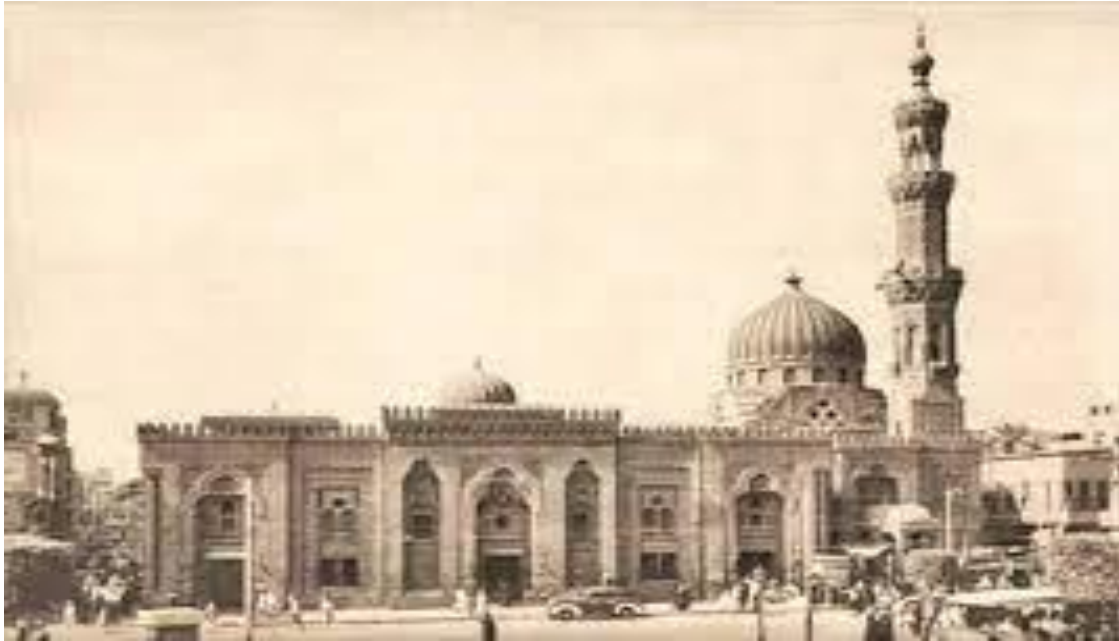
Moschea di al-Sayyida Zaynab al Cairo nel 1880.