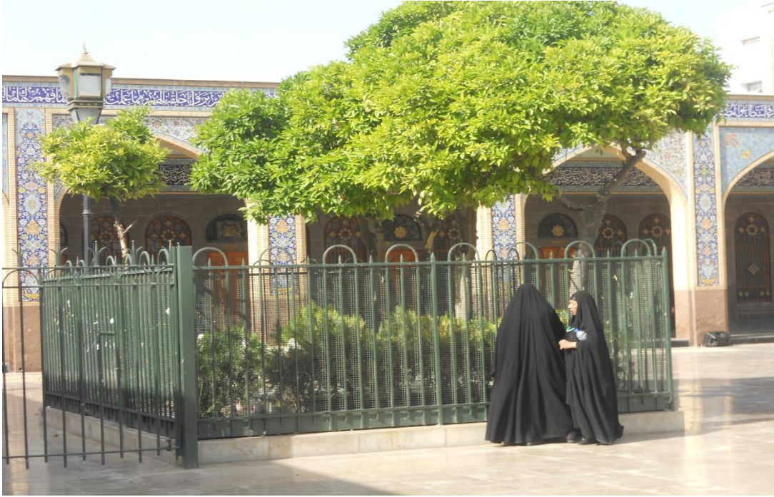
Fedeli sciite nella moschea di al-Sayyida Zaynab a Damasco (foto di Arianna Tondi, aprile 2010).