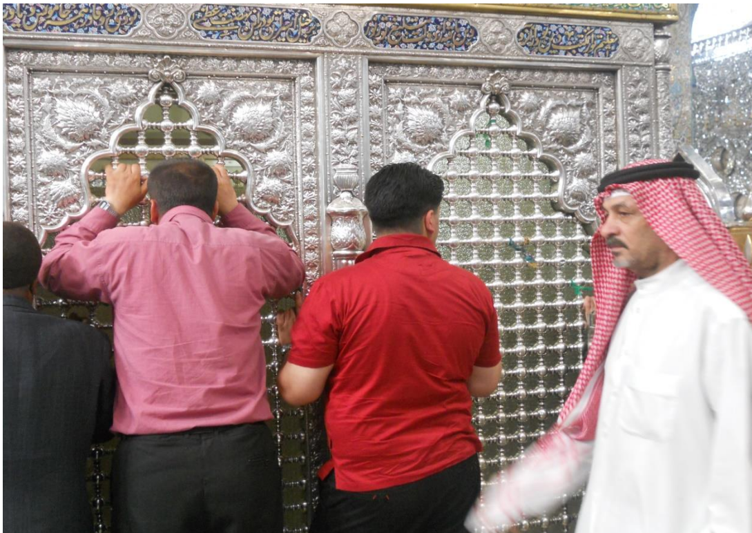
Devoti all'interno del mausoleo di al-Sayyida Zaynab a Damasco (aprile 2010).