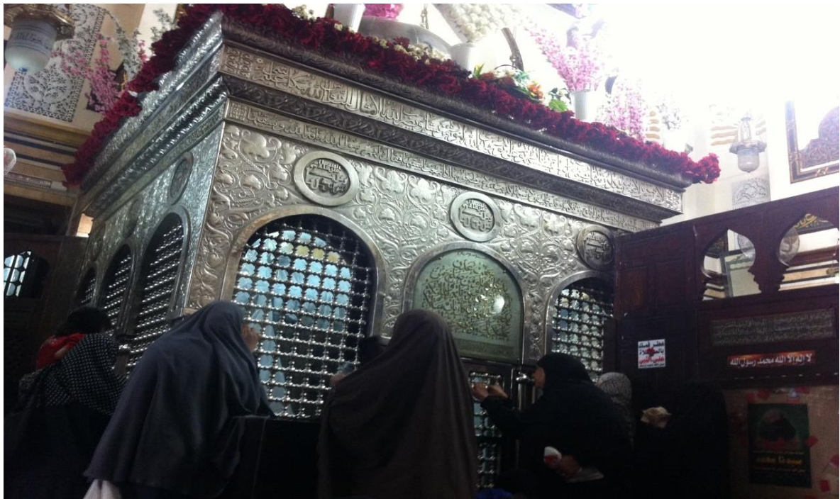
Devote nella parte della tomba riservata alle donne nel mausoleo del Cairo (luglio 2014).