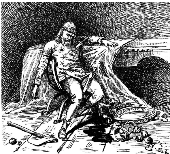
Fig. 4 | Odoacer death , incisione su legno del sec. XIX.

E per un certo tempo gli accordi furono osservati; ma poscia Teoderico, accortosi, come dicono, che Odoacre macchinava insidie contro di lui, ingannevolmente invitatolo a banchetto, lo uccise [...] (Procop. Goth. I 1,24) (Comparetti 2005: 6). 30