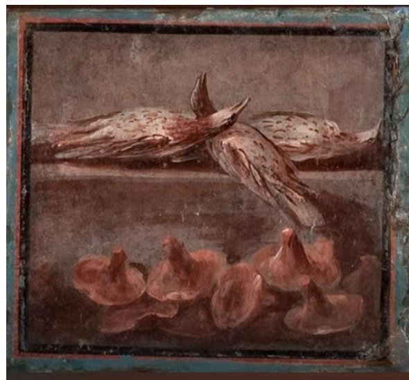
Fig. 3 | SPINA L., Quadri di nature morte ; Ercolano, Casa dei Cervi, IV 21, fotografia esposta presso il Museo Archeologico Nazionale di Napoli - MANN (n. inv. 8647) [Credits: su concessione del Ministero della Cultura - Museo Archeologico Nazionale di Napoli].

Sulla tavola dell'imperatore sono serviti spesso boleti , termine latino che nell'antica Roma sta però a indicare la famiglia delle Amanita , che può includere l' Amanita caesarea (il fungo prediletto, "cibo degli dèi", corrispondente al nostro ovolo e di alta commestibilità), ma anche l' Amanita phalloides , ai giorni nostri responsabile del 95% delle morti dovute a consumo di funghi. Non si può escludere che il decesso di Claudio sia dovuto quindi a una banale fatalità, ossia all'ingestione di un fungo tossico per natura, in quantità eccessiva e a fronte di un fisico già debilitato (Grimm-Samuel 1991: 178-192). 25