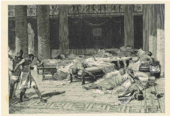
Fig. 1 | Banchetto capuano e suicidio dei senatori, 211 a.C. , incisione tratta da BERTOLINI F., Storia di Roma , ill. di POGLIAGHI L., Treves, Milano 1901, p. 161.

mente retorico di fronte ai suoi concittadini. Nell'ultima parte del monologo egli annuncia l'intenzione di suicidarsi, come ultimo atto di resistenza al potere romano e alle conseguenti sofferenze che avrebbero patito una volta riconquistati, invitando i notabili a un banchetto che possa fornire una "fine oltre che onorevole anche dolce": 7