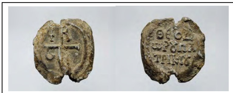
Fig. 1: Sigillo del patrikios Teodoro, recto e verso . Piombo. Ravenna, Museo Nazionale, inv. n. 509/2019, su concessione del Ministero della Cultura – Direzione regionale Musei dell'Emilia-Romagna, con divieto di ulteriore riproduzione o duplicazione con qualsiasi mezzo.

Verso : ΘΕΟΔ|ΩΡΧΠΑ|ΤΡΙΚΙΧ con piccola croce nella parte superiore e stella nella parte inferiore. Il campo è delimitato da un bordo a ghirlanda.