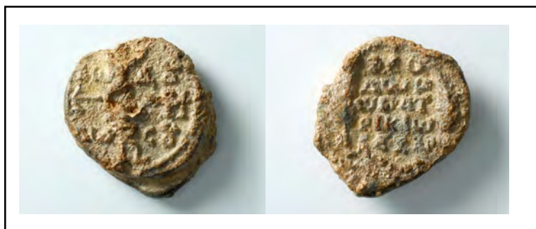
Fig. 2: Sigillo dell'esarco Teodoro II (678-686/7), recto e verso . Piombo. Washington DC, Dumbarton Oaks, Coins and Seals Collection, n. BZS.1955.1.1181

Teodoro patrizio e esarco 54 . La tipologia monogrammatica 55 e l'iscrizione 56 confermano, infatti, la sua compatibilità cronologica con l'esarcato del secondo Teodoro, ovvero nell'ultimo quarto del VII secolo.