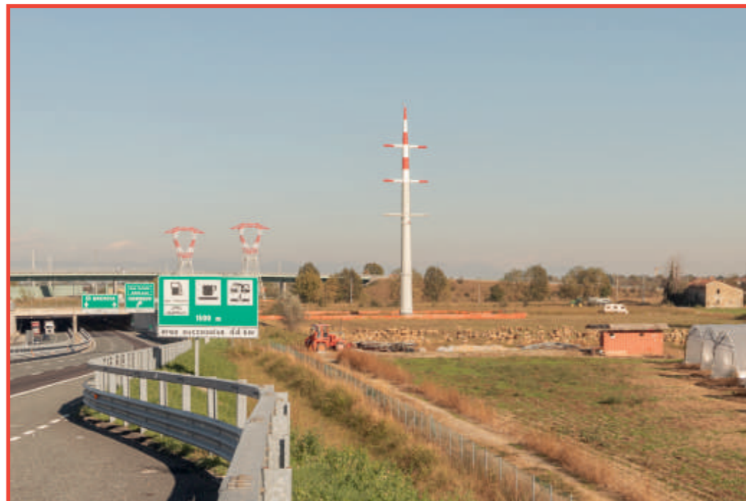
Fotografie di Fausta Riva

«Nel racconto del cambiamento della bassa pianura bergamasca, luogo di antiche transumanze e di trasformazioni recenti, rapide e violente, le pecore che pascolano a ridosso dei rilevati della nuova autostrada e dell'alta velocità non sono una semplice curiosità bucolica. Sono il segnale concreto dell'incontro incongruo e anacronistico tra un mondo passato, che evolve lentamente, e le ferite profonde e ancora aperte impresse dalla nuova modernizzazione forzata. La costruzione delle grandi infrastrutture, insieme alle opportunità che ha generato per il settore edilizio, industriale e oggi logistico, non sembra in grado di affrontare davvero le conseguenze ambientali e paesaggistiche portate, se non attraverso interventi di rimedio sempre tardivi e parziali».