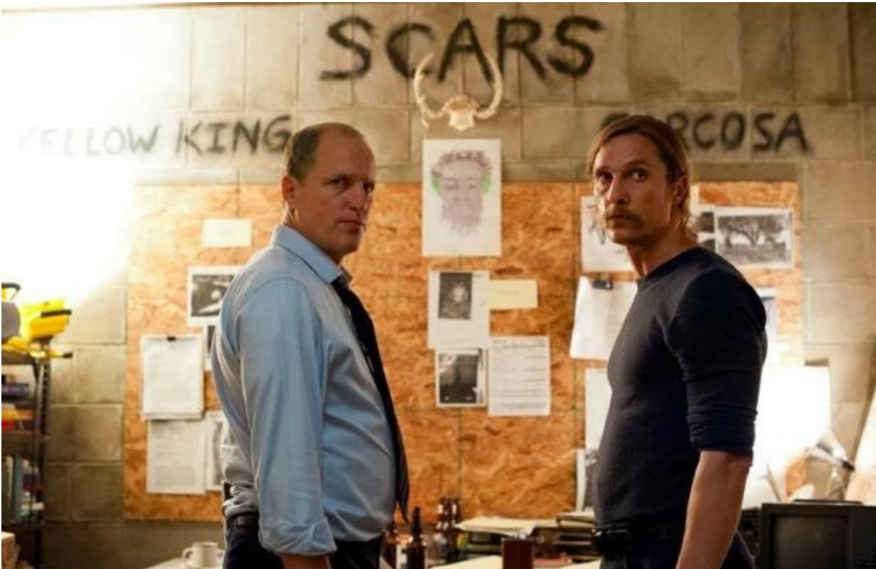
Marty Hart e Rust Cohle, True Detective

molteplicità di mondi possibili alternativi senza confondersi tra l'uno e l'altro, e non esitano a mentire, a ricattare, e persino a uccidere, pur di perseguire i loro scopi. La distinzione tra bene e male non è particolarmente rilevante, né per loro né per chi ne segue le vicende: conta l'abilità strategica di sopravvivere e di prosperare in ambienti spesso ostili o insidiosi.