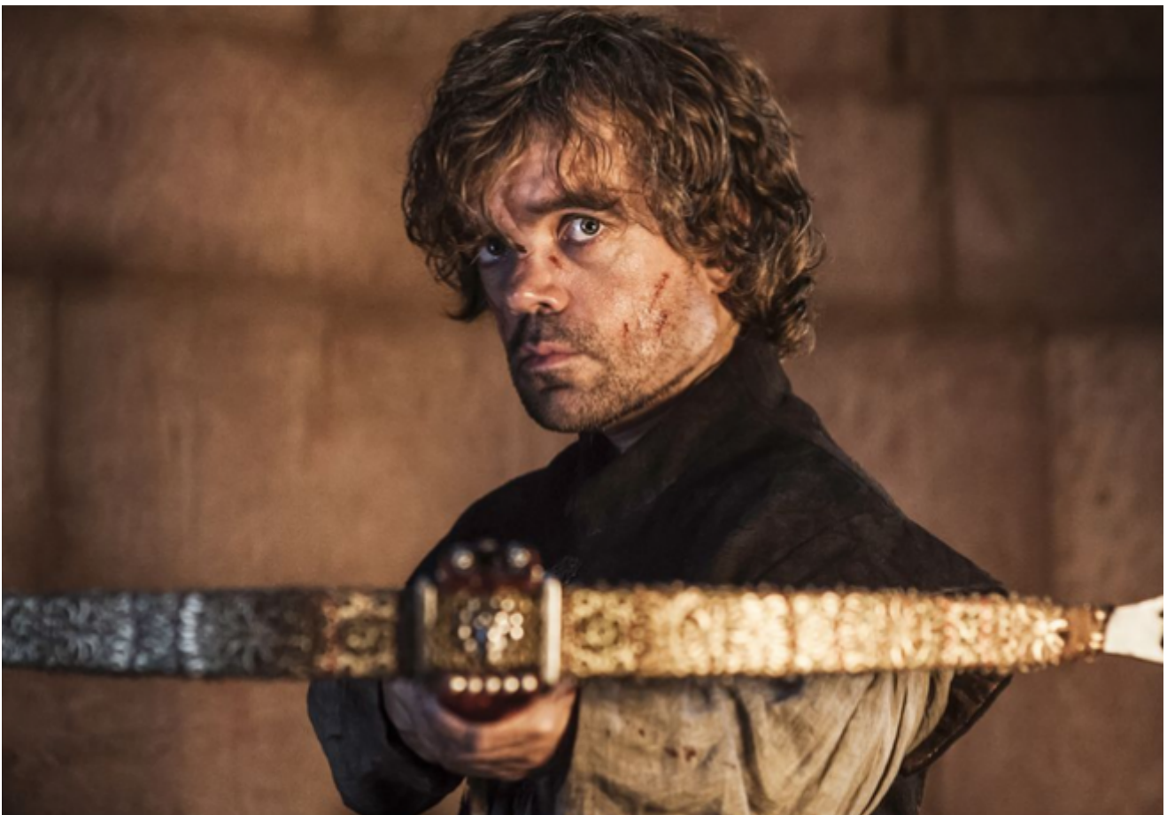
Tyrion Lannister, Game of Thrones

Data la varietà delle ambientazioni, dei motivi e dei generi (fantasy, medical drama, dark comedy, thriller psicologico, dramma storico...), non è sul piano tematico che va cercato il dispositivo ultimo dell'effetto seriale. E neppure su quello enunciativo: le tecniche di ripresa spaziano dallo sguardo in camera di Frank Underwood ai lunghi piani sequenza di True Detective , dalle inquadrature a volo d'uccello di Game of Thrones alla shaky camera di Homeland . L'essenziale è altrove, e più precisamente nell'azione combinata di tre elementi indispensabili, i quali a loro volta retroagiscono con le predisposizioni di un certo tipo di spettatori. Potrebbero essercene degli altri, e non mi è del tutto chiaro come i tratti che sto per elencare si amalgamino in un unico dispositivo generatore di senso. L'ipotesi di partenza andrà affinata, applicata a una varietà di casi, e magari riformulata: lo schema che segue è perciò la puntata pilota di una ricerca più ampia sulle possibili cause degli effetti di serie.