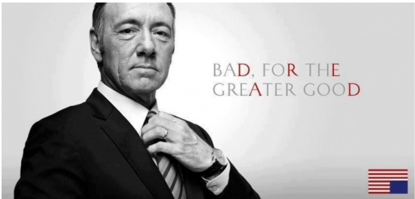
Frank Underwood, House of Cards

Primo, la serialità continua. È nota la differenza tra la serialità episodica delle sit-com (in cui ciascuna puntata è autosufficiente e riporta alla situazione di partenza), la serialità aperta delle saghe (in moto perpetuo verso ulteriori sviluppi), e le gradazioni intermedie della serialità a spirale (che combina iterazione e progressione) e della quasi-saga (serie progressiva con episodi incapsulati). Solo la serialità continua provoca la dipendenza di cui stiamo parlando qui. Né Dr. House né Sex and the City , né Friends né How I Met Your Mother ci hanno mai ridotti a schiavitù: uno o due episodi alla volta ci appagavano, e lo scioglimento dell'intreccio ci riportava dolcemente a terra. I serial continui viceversa frustrano il bisogno umano di compiutezza (closure), intrecciando trame e sottotrame che non si risolvono neppure a fine stagione, ed è questa vorticosa fuga in avanti a catturare il pubblico, come ben sapevano i romanzieri d'appendice. Con la differenza che in quel caso la scansione delle puntate imponeva un consumo dilazionato del racconto, laddove il libero accesso agli episodi in streaming ne incoraggia l'uso smodato e la conseguente insoddisfazione. Senza chiusura non c'è catarsi, e senza catarsi non c'è pacificazione col presente.