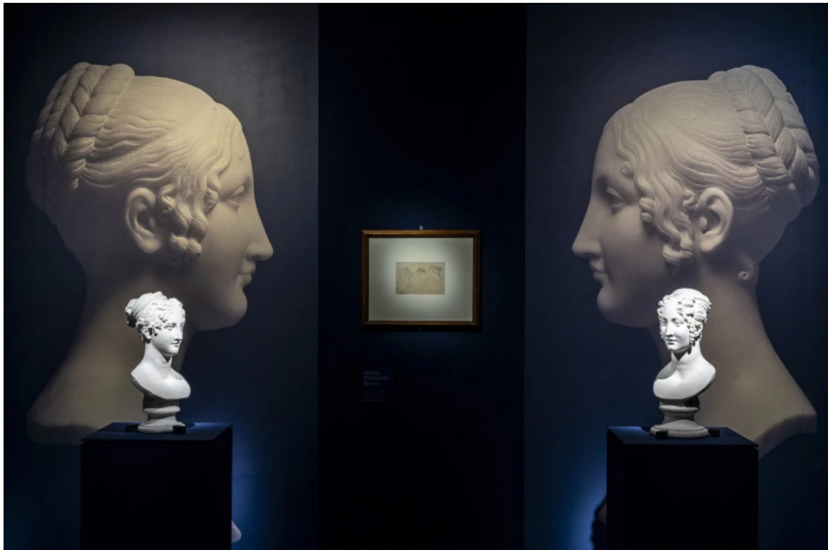
Gallerie d'Italia, Le Trecce di Faustina, Immagini di allestimento a cura di Marco Zorzanello.

Canova, piene di ricci inanellati in cui già s'intravedono gli intrecci delle Grazie . A guidarci lungo il percorso espositivo sono insomma le traiettorie dei capelli: fra alto e basso, spirito e materia, antico e moderno, simulacri e donne in carne e ossa.