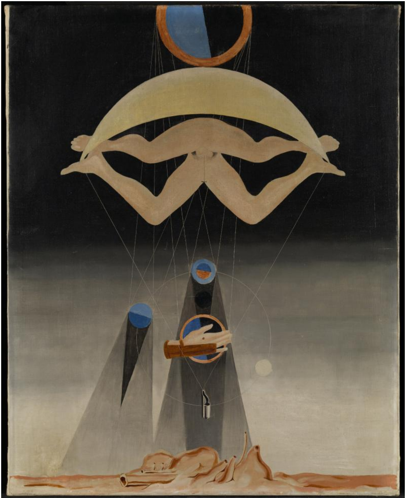
Gli uomini non ne sapranno nulla, 1923 .

Entriamo dunque con questo spirito nella mostra e nel mondo di Ernst, così vario in realtà da aver messo a disagio a lungo i critici e il mercato, eppure così coerente e conseguente da non aver fatto esitare un attimo l'artista sulla sua strada. La varietà non piace al mercato, eppure non è segno di grande creatività? È la ragione stessa del tardo riconoscimento arrivato a Ernst dopo