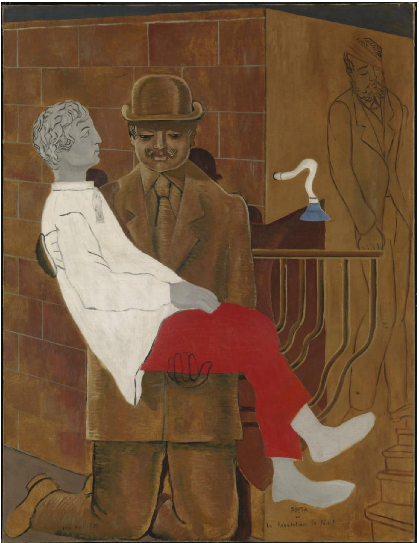
Pietà o La rivoluzione la notte, 1923.