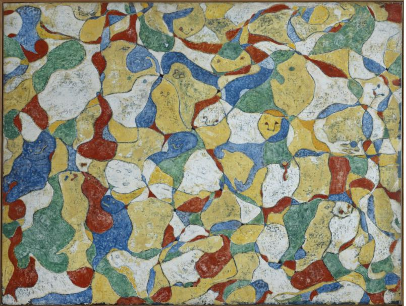
La festa a Seillans, 1964.

Ma Ernst aveva compreso che ad essere in gioco era un vero e proprio cambio di passo, di sensibilità, un pensiero visivo e un sentire inediti, che non potevano e non possono essere ridotti all'immaginazione e al simbolismo, alla malinconia e all'erotismo. Bisognava porsi "oltre", "al di là", appunto. Dada aveva segnato il punto di passaggio, la rimessa in discussione di ogni fondamento presunto e la riconsiderazione del rapporto tra gli opposti e di nozioni come quelle di caso e di creatività, ma occorreva attuare una vera e propria "transvalutazione", come pensatori quali Schopenhauer, Nietzsche e Freud avevano indicato, aggiornata e realizzata in termini ulteriormente contemporanei.