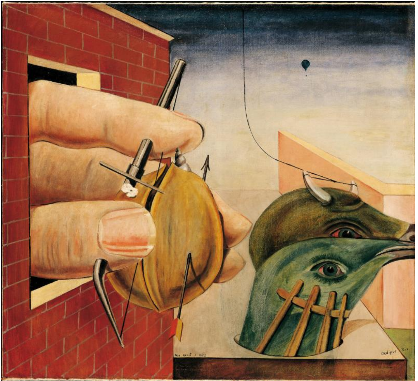
Oedipus Rex, 1922.

Bisogna affrontare in questo modo un artista surrealista, tanto più l'artista surrealista per eccellenza – checché ne dica Salvador Dalì e nonostante i litigi fino all'espulsione dal gruppo da parte dello stesso Breton. È ormai una leggenda l'arrivo della cassa con i primi collage, 1921, che saranno esposti alla galleria Au Sans Pareil, dando il via alla ricerca di una teoria che diventi quella del passaggio dal Dadaismo al Surrealismo. Con quali ingredienti e tonalità? Lo si coglie subito all'entrata della mostra a Palazzo Reale: già sulla soglia d'ingresso ci si presenta di fronte Oedipus Rex . È uno dei capolavori dell'anno seguente, 1922, quando Ernst ha già capito dove andare: il collage non è una tecnica, è una forma del pensiero, l'incontro di elementi incongrui che creano legami di senso ed effetti di meraviglia, di senso "metafisico", come ha appreso da de Chirico, e di meraviglia trasfigurativa del reale, cioè surreale, "convulsiva", secondo la formula di Breton.