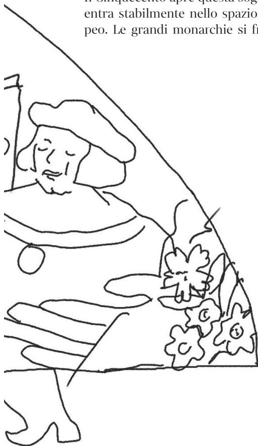
Il bozzetto dell'illustrazione di Alice Piaggio per Margherita di Valois

Ma questa capacità di tenuta non si esaurisce nella scena pubblica. Si manifesta anche dove il potere, secondo le regole di corte, dovrebbe arrestarsi. Margherita trasgredisce. Non in modo clamoroso, ma sistematico. Si occupa direttamente della cura e dell'educazione del figlio, opponendosi alle consuetudini aristocratiche e, in questo, anche alla linea di Emanuele Filiberto. La cura del corpo del principe – fragile fin dalla nascita, segnato da problemi di salute e da una debolezza fisica persistente