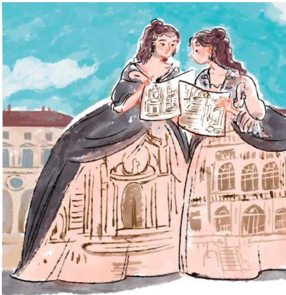
Il primo bozzetto dell'illustrazione di Ilaria Urbinati per le Madame Reali