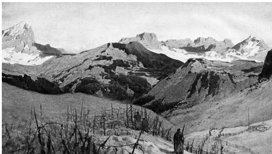
Fig. 1: Karl Ludwig Prinz, Col di Lana.

applicarlo all'Italia: «Or non si potrebbe fare alcunché di simile da noi? Io crederei di sì [...]. Ei mi pare che non ci debba voler molto per indurre i nostri giovani, che seppero d'un tratto passare dalle mollezze del lusso alla vita del soldato, a dar di piglio al bastone ferrato ed a procurarsi la maschia soddisfazione di solcare in varie direzioni e sino alle più alte cime queste meravigliose Alpi, che ogni popolo ci invidia. Col crescere di questo gusto crescerà pure l'amore per lo studio delle scienze naturali, e non ci occorrerà più di veder le cose nostre talvolta studiate più dagli stranieri, che non dagli italiani». 5