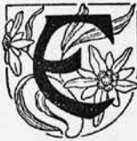
Illustration nach Aufnahmen des Verfassers.

in ganz eigenartiger, den Soldaten unbekannter Dienst rief unser Regiment im Frühjahr 1918 an die Nordostmarken des Landes. Weniger waren es diesmal militärische Aufgaben, die uns zufielen, als vielmehr zollpolizeiliche. Der Mangel an Lebensmitteln und Bedarfsartikeln in den Zentralmächten zog einen blühenden Schmuggel groß, der an der ganzen Ausdehnung der Nordostgrenze einen für unser Land bedrohlichen Umfang angenommen hatte. Das Militär mußte einschreiten. Neben dem Hauptziel, den Schmuggel möglichst zu unterbinden, harrten unser als militärische Aufgaben Sicherung der Grenzübergänge und Beobachtung der Vorgänge an und jenseits der Grenze. Zu diesem Zwecke wurden an den geeigneten Punkten Posten aufgestellt, die ein reger Patrouillenverkehr in steter Verbindung hielt. Diese Maßnahmen konnten den Schmuggel zwar nicht gänzlich aus der Welt schaffen, erschwerten ihn aber wesentlich und erhöhten vor allem die damit zusammenhängende Romantik.