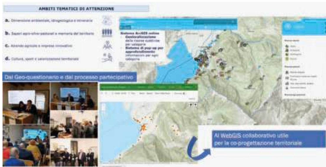
Figura 1 – Pisogne Map: mapping digitale per la creazione di ecosistemi territoriali di innovazione.

Provincia di Brescia, per una rigenerazione in rete tra lago e montagna; e due progettualità avviate in Provincia di Bergamo, per il Piano di Sviluppo Locale del GAL-Gruppo di Azione Locale dei Colli di Bergamo e del Canto Alto e per la rigenerazione territoriale e reticolare della Valle di Scalve.