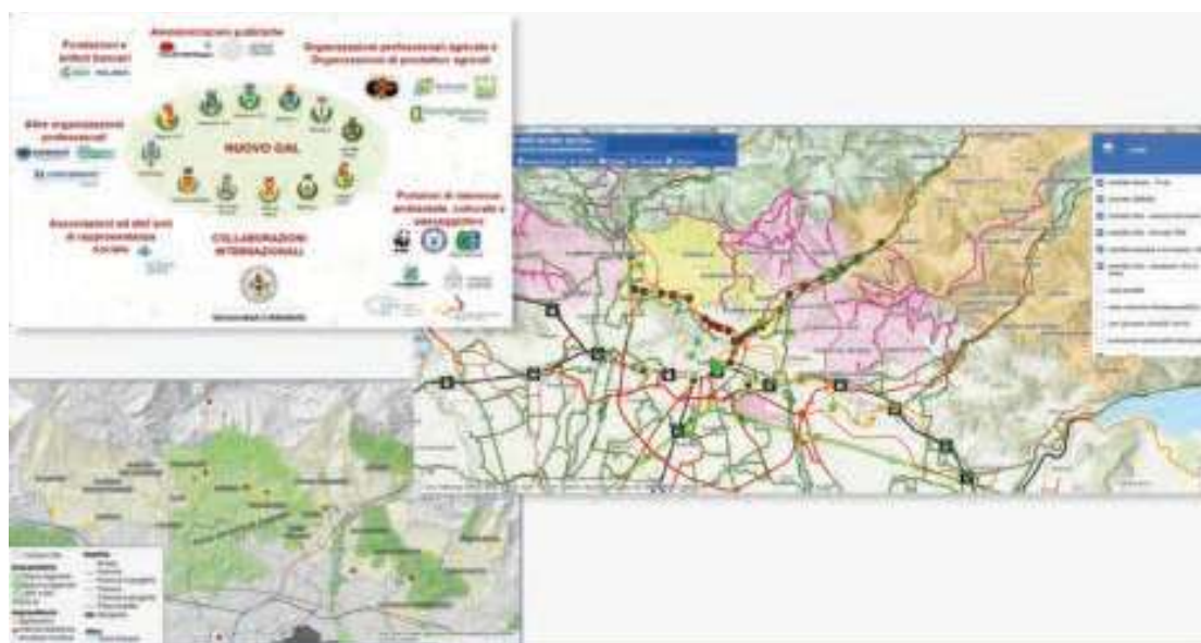
Figura 2 – Web App Piano di Sviluppo Locale 2023-2027 del GAL dei Colli di Bergamo e del Canto Alto .

In tale prospettiva, a supporto delle due fasi della ricerca, l'Imago Mundi Lab ha sviluppato una Web App che ha integrato una mappatura interattiva, aggiornabile in tempo reale, in grado di visualizzare risorse e bisogni territoriali e che, lungi dal costituire un mero strumento tecnico, diventa la base per una co-progettazione strategica ancora in corso. Infatti, il sistema cartografico digitale è stata la base per consolidare, con il supporto scientifico dell'Imago Mundi Lab, l'ampliamento territoriale del GAL ma soprattutto per rafforzarne il ruolo di catalizzatore di sviluppo e innovazione territoriale proiettando l'intero sistema territoriale dei 19 Comuni della fascia periurbana settentrionale di Bergamo in un'inedita fase di progettazione territoriale condivisa e unitaria, e sottolineando al contempo la sua funzione di connessione collinare tra la montagna, la città e la pianura bergamasca.