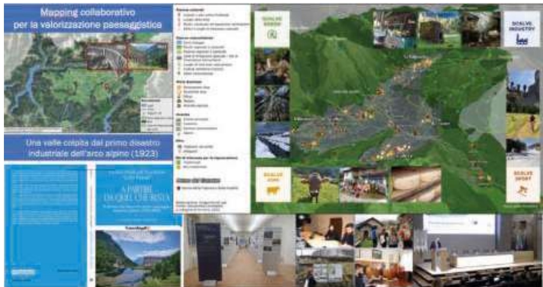
Figura 3 – Scalve Map: un sistema per la co-progettazione territoriale di fronte alle sfide globali.

di mapping collaborativo che ha permesso la ricognizione partecipata delle risorse del territorio della Valle di Scalve, mettendo in evidenza la ricchezza di oltre 300 risorse distribuite all'interno del territorio considerato. Le risorse identificate includono elementi culturali, naturali, opportunità di micro-imprenditoria e percorsi per la mobilità sostenibile, alcuni dei quali si prestano a iniziative di rigenerazione e che possono essere valorizzate attraverso strategie di sviluppo, anche in chiave di turismo responsabile e diffuso (Burini e Ghisalberti, 2024).