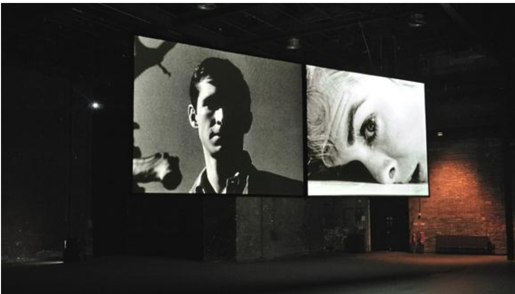
Fig. 2: Douglas Gordon, 24 Hour Psycho Back and Forth and To and Fro , 2008. Installazione, Tramway, Glasgow, UK, 2010