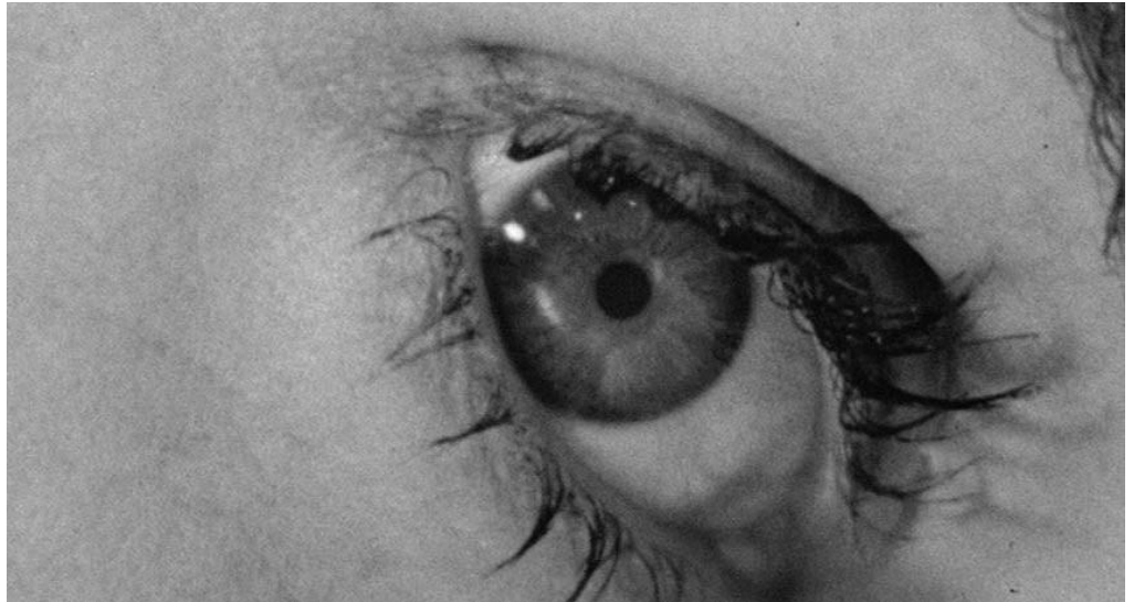
Fig. 4: Fotogrammi di una famosissima sequenza di Psy- cho di Hitchcock 1960.