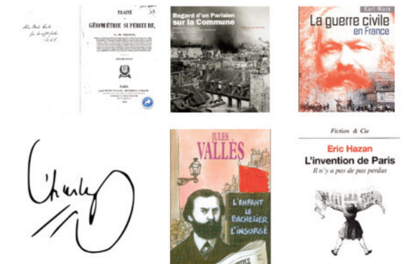
Fig. 9 Michèle Audin, Mai quai Conti , 2014. Images-rimes : toponymes inspirés par la Commune.

Fig. 8 Michèle Audin, Mai quai Conti , 2014. Images-rimes : ouvrages concernant la Commune.