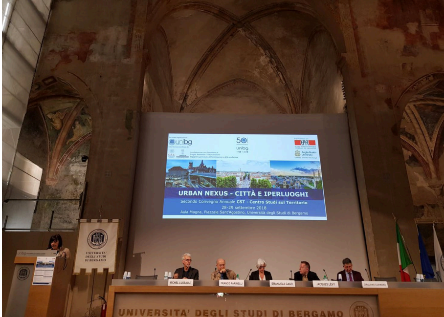
Fig. 1 – La prima sessione del convegno internazionale Urban nexus: città e iperluoghi .

In tale prospettiva, l'evento ha posto nuovi interrogativi per l'analisi dei Big Data, ribadendo la centralità della geografia per la loro interpretazione alla luce dei fenomeni urbani mondializzati, così come per il dialogo con gli attori pubblici e privati nel segno della Terza Missione universitaria.