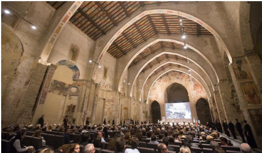
Fig. 2 – La sede del convegno Urban Nexus : l'Aula magna dell'Università degli Studi di Bergamo.