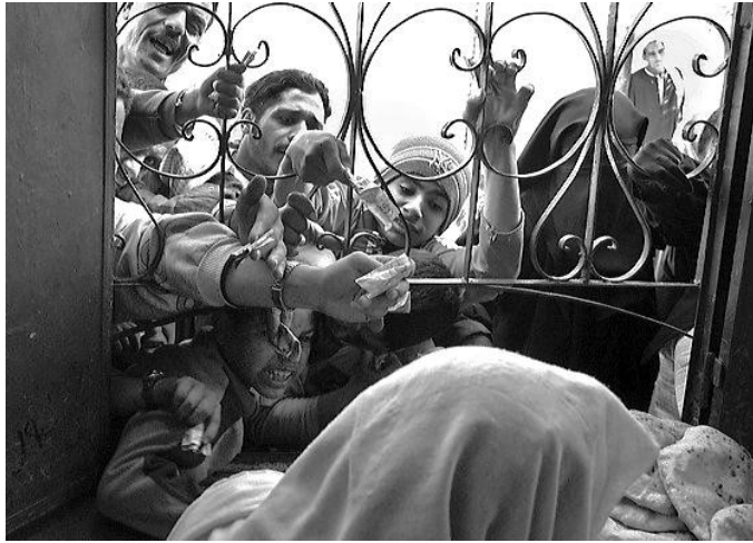
Fig. 5 La crisi economica porta alla cosiddetta “Rivolta del pane”, 1977.