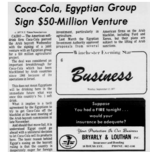
Fig. 4 Articolo tratto dal Winchester Evening Star , 12 settembre 1977.

Senonché, le circostanze mutano continuamente, come sapete. Da un lato, il suo piano è fallito per vari motivi che ora non è possibile ricordare in dettaglio, mentre, dall'altro, il boicottaggio, dalla sera alla mattina, non è sembrato più necessario. Il 'dottore', nel frattempo, era già riuscito opportunamente a superare gli enormi ostacoli che avevano a lungo separato la bibita eccitante dai suoi estimatori egiziani. L'azienda, pertanto, ha ricambiato i suoi sforzi assegnandogli l'esclusiva dell'imbottigliamento della Coca-Cola in Egitto (Ibrahim 2003: 60-61).