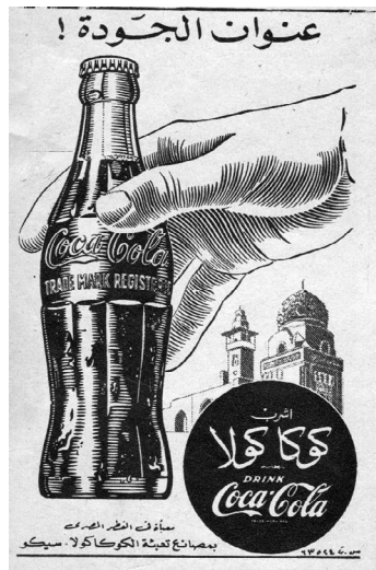
Fig. 1 Pubblicità della Coca-Cola nell'anno della Rivoluzione, il 1952.

[Fig. 1], solo apparentemente poco rilevante, ma la cui origine e diffusione sono state d'impatto globale nel XX secolo, considerati i legami, diretti e indiretti, che il prodotto ha con personaggi, eventi, progressi tecnologici, rivoluzioni e ideologie. 6 In conclusione della sua dissertazione al cospetto della Commissione, il narratore sintetizza con queste parole il peso della bibita americana sulla storia contemporanea: