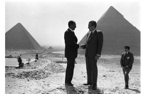
Fig. 2 Sadat e Nixon alle Piramidi, 1974.

Mantenere equilibrio tra ciò che è noto e ciò che è opportuno dichiarare è il gioco pericoloso in cui si destreggia il protagonista, anche quando gli viene posto un secondo quesito, questa volta riguardante l'antichità, nella fattispecie la Grande Piramide [Fig. 2], un argomento che ben conosce e che tuttavia può rivelarsi insidioso, a partire dalla domanda stessa: "Considerata l'importanza che per lei ricopre la struttura piramidale, 7 ebbene, ora ci occuperemo della Grande Piramide. Non ho alcun dubbio che a lei piacerebbe sedersi sull'apice. Comunque, ha piena libertà di scegliere l'angolazione da cui disquisirne" (ivi: 24). Va sottolineato che, come appare in questo passaggio, al protagonista viene spesso ricordata la sua personale libertà di scelta, essenziale al processo di scoperta, sebbene sembri che egli si trovi piuttosto in uno stato di coercizione, prima latente e poi gradualmente manifesto, tant'è che l'atmosfera kafkiana del romanzo, messa in risalto da Ben Hammed (2019: 54) e altri autori, induce il lettore a cogliere una sproporzione di forze tra l'onnipotente organizzazione e l'anonimo individuo che essa tiene in scacco, pur stimolandone ingegnosità e intraprendenza.