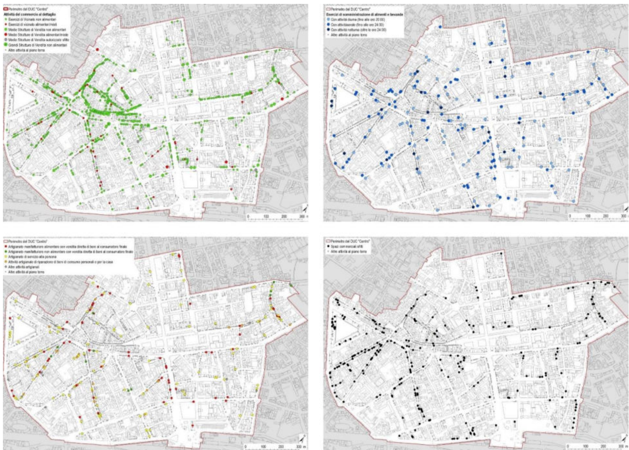
Figura 2. DUC di Bergamo, polarità Centro , geografia dell'offerta delle attività economiche urbane.

Se in altri contesti (come lungo l'asse di via Papa Giovanni XXIII, che dalla stazione porta verso il centro città) la trasformazione dell'offerta si avverte in misura minore (“Sostanziale equilibrio”), la maggior percentuale di dismissioni – in totale – si concentra negli spazi più periferici, al di fuori dagli ambiti sopra citati ed evidenzia un processo di progressiva “scomparsa-desertificazione” di quelle aree in cui gli esercizi commerciali sono più dispersi, e non danno luogo a sistemi integrati d'offerta.