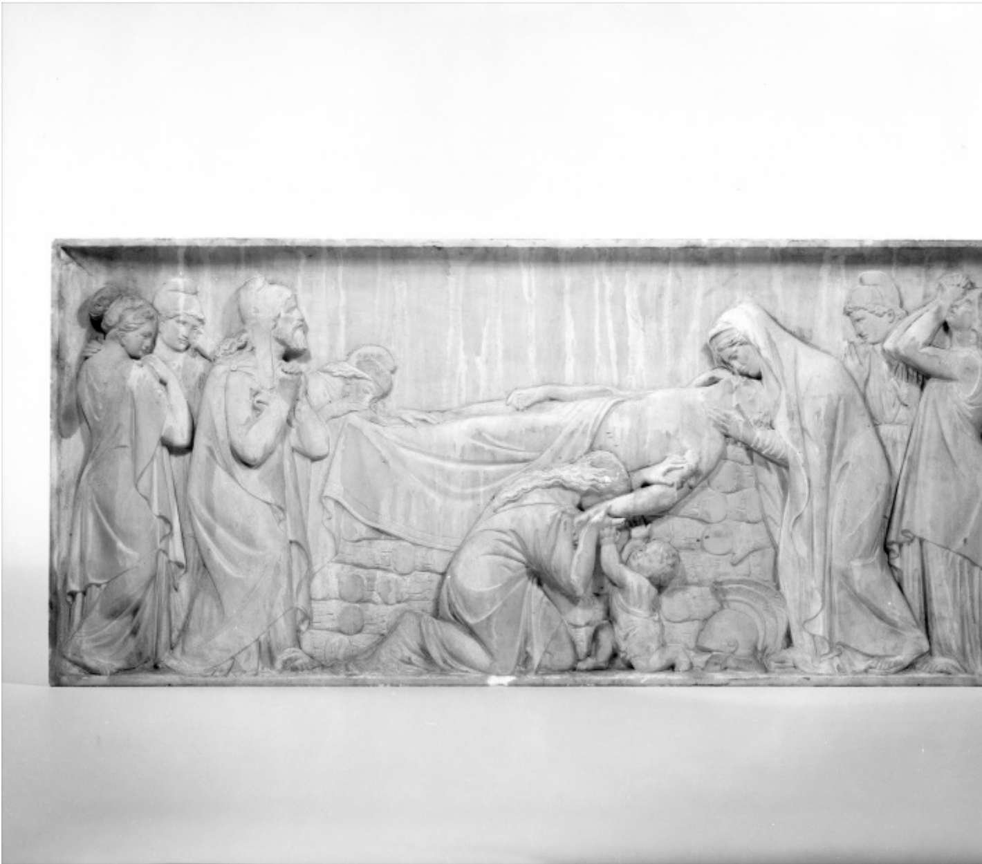
Ettore disteso sulla pira funeraria, Giovanni Maria Benzoni.

gli esperimenti letterari (sia in forma di continuità, che di innovazione) sono sopravvissuti attraverso il tempo, ma a parlare e a far parlare (anche a livello transmediale: pensiamo ai film, alle serie e ai videogiochi che riprendono o hanno a che fare con l'immaginario dell'Iliade e dell'Odissea) l'epopea omerica sono i suoi personaggi – il loro carattere, in senso aristotelico: ciò che sono e come si comportano. Ogni figura, da Achille a Priamo, diventa la sede per una riflessione transtorica del modo in cui l'immagine che il poeta e i suoi lettori hanno di sé e della propria società viene restituita. In particolare, nella rilettura di Fox un grande rilievo – accanto ai grandi eroi omerici – rivestono le figure femminili, come le donne dalle candide braccia (Criseide, Briseide, Elena), le madri regali (Ecuba, Elena e Andromaca), le dee amiche e nemiche (Era e Atena, Artemide e Afrodite), i cui ritratti “sono esempi inconfutabili dell'empatia e dell'intelligenza emotiva di Omero” (p. 418), tesi a delineare, per riflesso e per contrasto, il sistema di valori e di giustizia a cui tutti i personaggi omerici sono sottoposti.