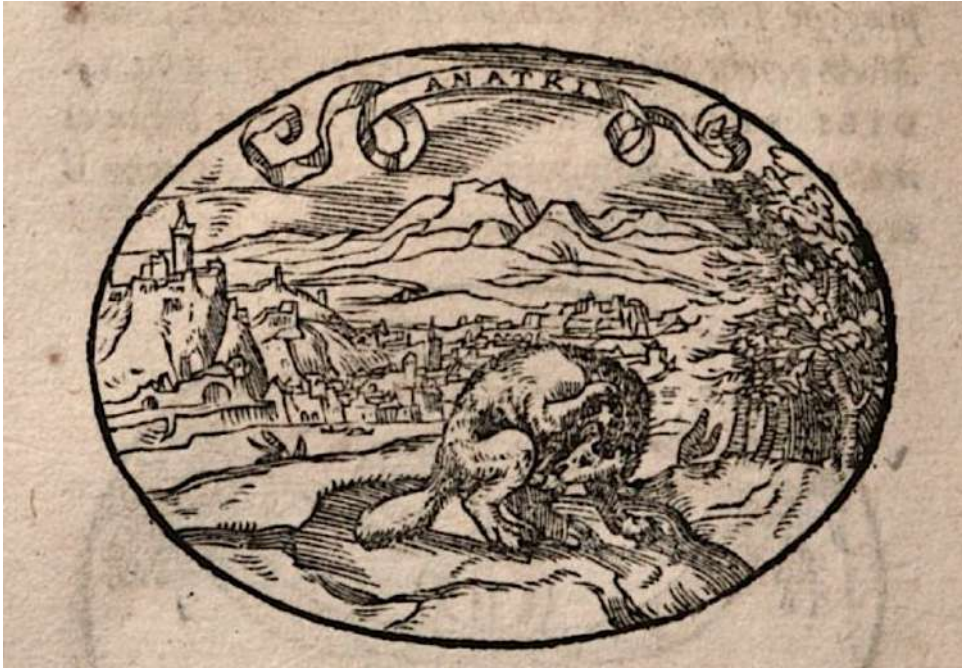
Figura 3 - Dialogo dell'impresie militari et amoroze di monsignor GIOVIO , Guglielmo Rovillio, Lione 1574, p. 156.

Ercole Tasso propone anche un esempio concreto, tratto dal Dialogo dell'impresie militari, et amoroze di monsignor Paolo Giovio , ove è censita un'impresa che raffigura «Castore, che si divelle co' denti i testicoli: Impresa a se medesimo rizzata da Monsig. Giovio, con la parola ANATKI, che necessità significa». La scelta della scena raffigurata, presente nelle edizioni illustrate dell'opera di Giovio, forse non nobile, anche se bene esplicativa dell'idea di necessità, pare a Tasso poco onorevole per chi intenda fregiarsi di tale impresa.