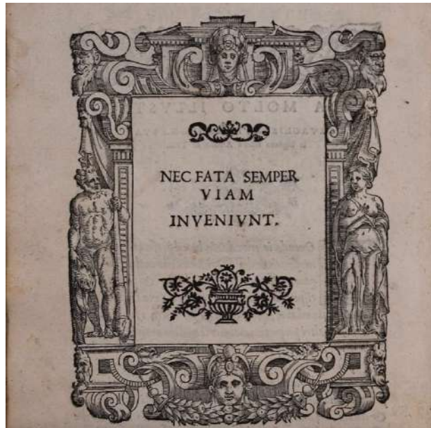
FIG. 3 – E. Tasso, La Virginia , cit., c. Aiiiv: Nec Fata Semper Viam Inveniunt