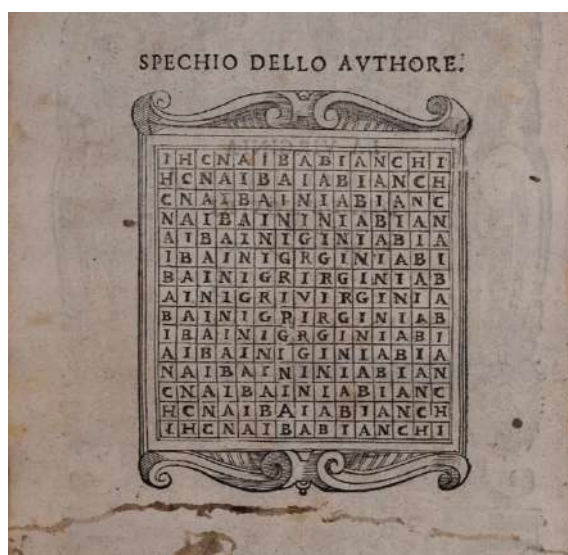
FIG. 2 – E. Tasso, La Virginia , cit., c. Aiv: Spechio dello Authore