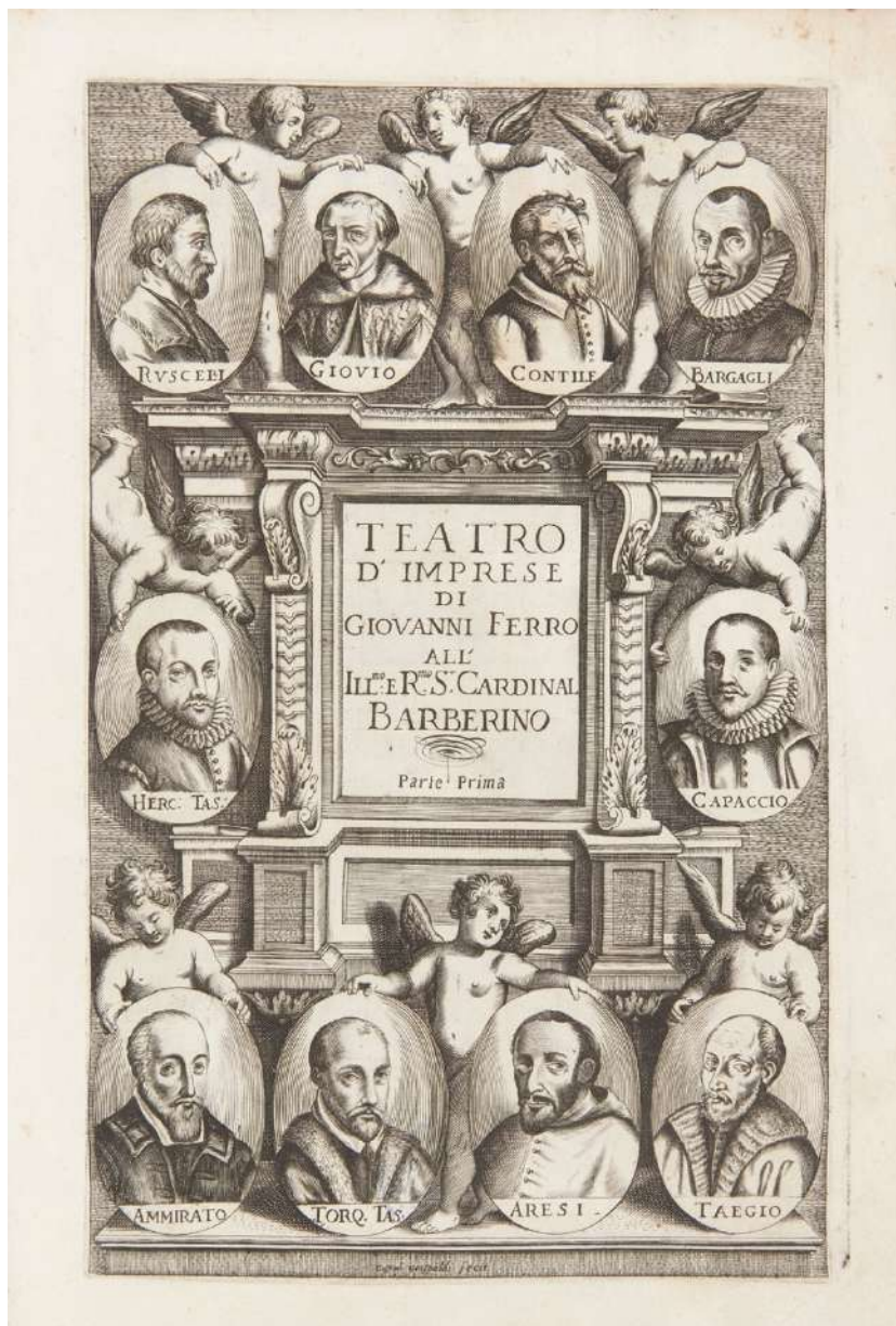
Figura 2 – G. FERRO, Teatro d'Imprese , G. Sarzina, Venezia, 1623, frontespizio.

lanese, fondatore dell'accademia dei Pastori di Agogna (Novara) e autore di un trattato nel quale «si ragiona dell'arte di fabricare le imprese conformi a i concetti dell'animo». 10