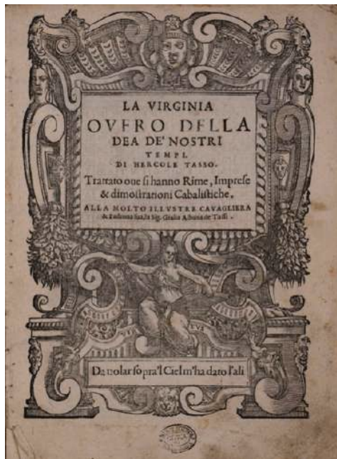
FIG. 1 – E. Tasso, La Virginia ouero della dea de' nostri tempi. Trattato oue si hanno rime, imprese & dimostrazioni cabalistiche , Bergamo, Comin Ventura, 1593, coll. TASSI A CASS I.1/2, c. Air: frontespizio