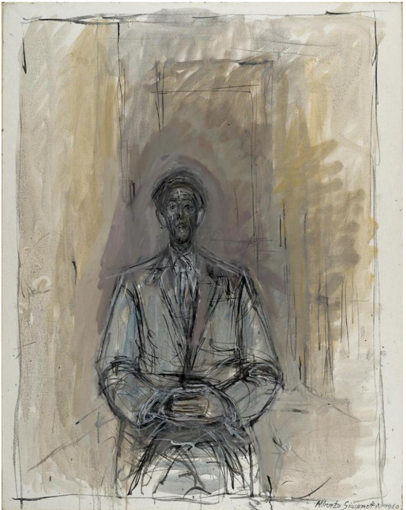
Ritratto di Isaku Yanaihara, 1960. Olio su tela, 92 x 72,6 cm.

Come se non se ne fosse scritto tanto, e tanto ne abbia detto lo stesso Giacometti nelle numerose interviste: vedere, fenomenologia della visione,