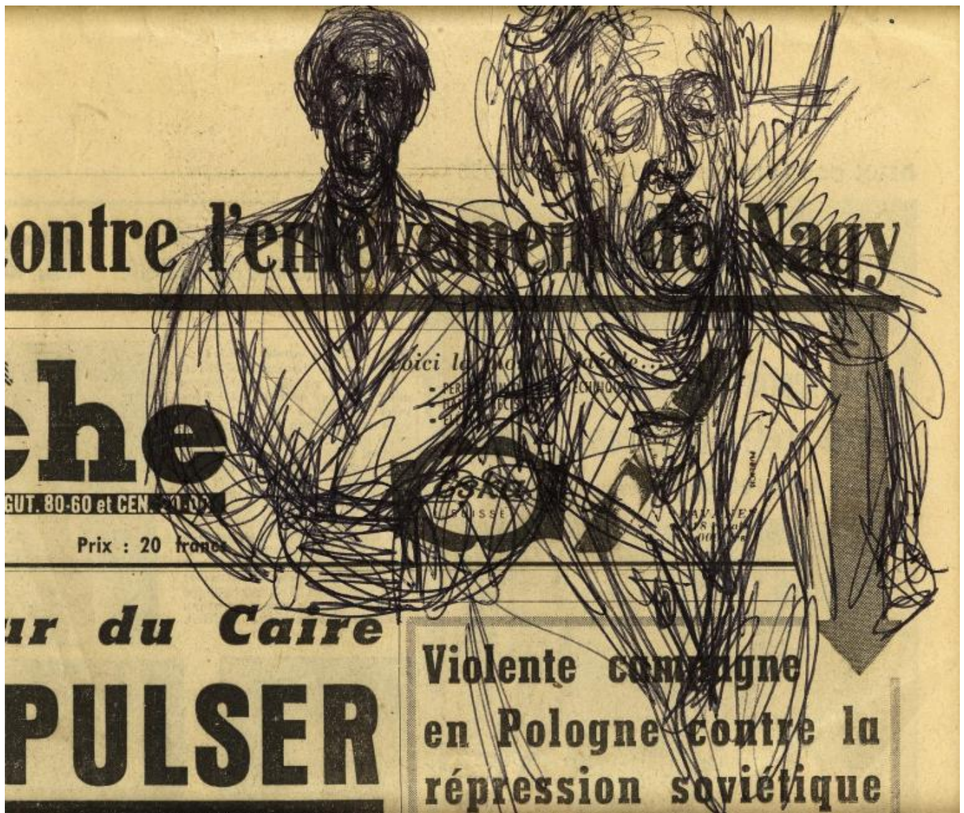
Doppio ritratto di Isaku Yanaihara, 25 novembre 1965. Penna biro su giornale, 16,5 x 20 cm.

La seconda, del tutto diversa, alcuni anni fa: l'artista Fabio Sandri ha messo a punto uno strano dispositivo fotografico composto da uno di quei garage di metallo prefabbricati, tipo container, con all'interno una videocamera che riprende chi si affaccia all'entrata e un proiettore che proietta l'immagine su una carta emulsionata appesa libera alla parete di fondo. Occorre stare una ventina di minuti perché l'immagine si fissi e bisogna stare il più immobili possibile. Una tortura! Psicologica soprattutto, evidentemente. Di nuovo: cosa pensare mentre ci si sforza di non muoversi? Provate davanti a uno specchio, qualcosa del genere.