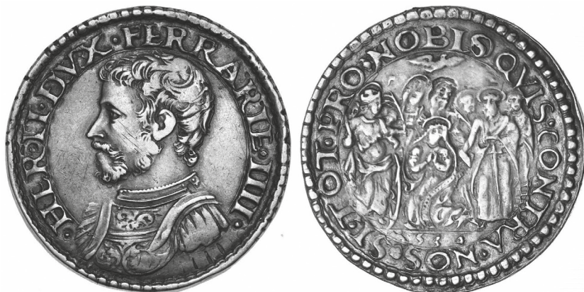
Figura 1. Bartolomeo Nigrisoli (attribuito a), Testone in argento celebrativo per l'investitura di Ercole II d'Este a duca di Ferrara; recto : busto del duca con la scritta HER. II DVX FERRARIE IIII; verso : la Beata Vergine inginocchiata in adorazione, circondata da un gruppo di Santi e una colomba in alto, con il motto SI TOT PRO NOBIS QVIS CONTRA NOS; g 9,57, diam. mm. 29,78 © Cambi Casa d'Aste 2025.

Soprattutto quest'ultimo punto di incontro tra l'encomio letterario e l'autoc elebrazione figurativa invita a proseguire nello studio del rapporto tra testi encomiastici o con riferimenti ad eventi storici di età rinascimentale nella consapevolezza che spesso sono le immagini il primo veicolo della lode, il terreno comune tra i diversi mezzi di promozione e autopromozione culturale del potere (aspetto, del resto, già appurato da molti altri esempi simili). 42 Oltre a confermare la centralità delle immagini, il caso della celebrazione del neoeletto duca Ercole II d'Este sembra suggerire che la mediazione tra una teoria retorica (al tempo ancora in movimento) e la pratica dell'encomio letterario avvenga grazie a quei modelli concreti, classici e del recente passato, che più profondamente ispirano gli autori e legittimano 'sul piano teorico' la scelta di topoi e tropi : scelta su cui incidono, dal lato opposto, anche le circostanze particolari dell'evento celebrato. Ad arricchire questo terreno comune fatto di immagini, di modelli di scrittura e di occasioni reali, concorrono poi anche quei precetti compositivi illustrati dalla retorica antica e tardoantica, recepiti e assimilati lungo tutto il corso del Rinascimento, di cui sarebbe opportuno tentare una sistematizzazione al fine di poter così disporre, nel confronto tra più e diversi casi-studio, di tutti gli elementi con cui gli autori costruirono, man mano, le forme più fortunate dell'encomio letterario.