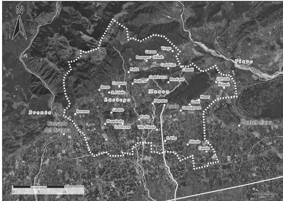
Fig. 1. Mappa della podesteria di Asolo con idrografia, centri principali e confini della podesteria (rielaborazione da L. BULIAN, Asolo cit., p. 5).

Antichità e alto Medioevo, il temporaneo offuscarsi demografico ed economico di Padova determinò la fine di questo sistema pianura-collina e, di conseguenza, una pesante ridefinizione del popolamento nella stessa fascia collinare, con Asolo che passò tra 825-827 e 969 da sede diocesana a sottoposta a quella di Treviso 7 . A venire irrimediabilmente meno fu soprattutto il sistema viario romano, fondato nell'area sulla compresenza della Postumia, che tagliava l'Italia padana da Genova a Trieste, e della strada che collegava Padova/ Patavium al