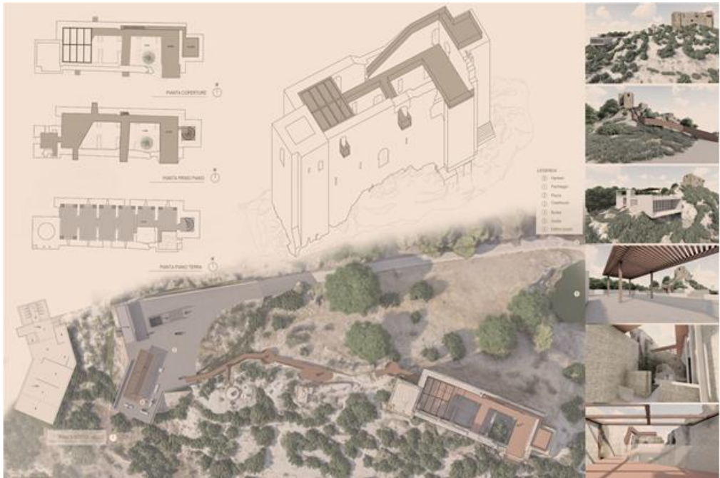
Fig. 4 - Masterplan con l'indicazione degli interventi progettuali (autori)

ed oggetti, ma da pannelli con testi, immagini e rimandi a contenuti multimediali fruibili dai visitatori attraverso i propri smartphone . L'accessibilità all'area sarà migliorata con l'introduzione di un parcheggio situato ai piedi della collina, strategicamente posizionato per non interferire con il contesto visivo e paesaggistico. Da qui, un percorso pedonale guiderà i visitatori verso la piazza principale, un punto che offre una vista privilegiata sul Castelluccio. La piazza sarà arricchita da elementi di arredo urbano, tra cui sedute distribuite in modo da favorire momenti di sosta e relax, e un pergolato che creerà un'ombra naturale e inviterà alla sosta, fornendo un luogo di incontro e riposo. Al di sotto della piazza, l'inserimento di un edificio ipogeo, presenza discreta e rispettosa del luogo, ospiterà uno spazio polivalente, dedicato alla ristorazione e progettato per accogliere eventi e attività culturali, adattandosi a diverse esigenze.