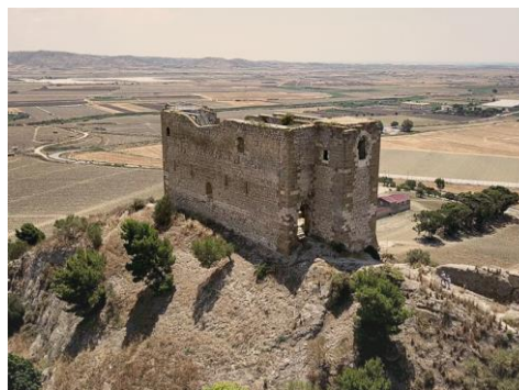
Fig. 1- Il Castelluccio di Gela, oggi

Del sistema di fortificazione faceva parte il Castelluccio, edificio monolitico posto a ponente del fiume Gela, concepito come presidio strategico e simbolico (Fig. 1). La sua funzione era duplice: difensiva, poiché garantiva il controllo delle vie di accesso interne e della vallata, e rappresentativa, in quanto segno tangibile dell'autorità imperiale. Non un castello ma una residenza come dimostrato dalle sue 'forme' (Cadei, 1995): una pianta rettangolare articolata in tre quadrati scanditi da cinque archi trasversali che sorreggevano la copertura in travi lignee, incannicciature in gesso e laterizi, accompagnata agli estremi da due torri avanzate sul lato meridionale e concepite come cubi sovrapposti. Realizzata in una zona economicamente scoperta, tale domus , integrandosi nell'ampio disegno politico, economico e militare di Federico II di Svevia susseguente alle costituzioni melfitane, avrebbe permesso di innalzare gli abitanti della nuova