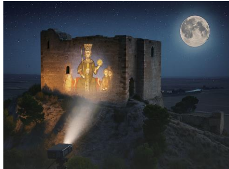
Fig. 5- Simulazione del video mapping (autori)

Le politiche di promozione culturale attuate a livello regionale non hanno incluso in modo esplicito il Castelluccio: il progetto La Collina di Gela. Reti e nodi multimediali , finanziato con oltre due milioni di euro attraverso il PON Cultura e Sviluppo 2014-2020, ha riguardato la dotazione tecnologica del parco archeologico cittadino senza però prevedere interventi specifici sull'edificio, mentre lo stanziamento di oltre tre milioni di euro annunciato nel 2025 dalla Regione Siciliana per la conservazione del patrimonio artistico non risulta destinare fondi a questo sito. Alla luce di tali evidenze, il Castelluccio si configura come un bene solo in parte recuperato